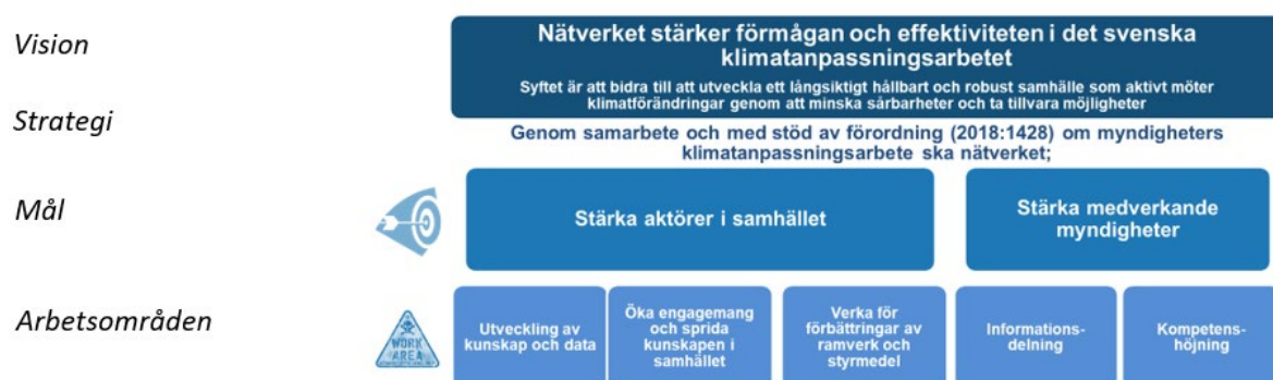
Figur 1. Vision, strategi, mål och arbetsområden för Myndighetsnätverket för klimatanpassning.

Nätverket formulerade hösten 2019 ett övergripande ramverk som innefattar en vision, en strategi samt målsättningar och därtill prioriterade arbetsområden. Nedan följer en mer detaljerad beskrivning av respektive nivå.